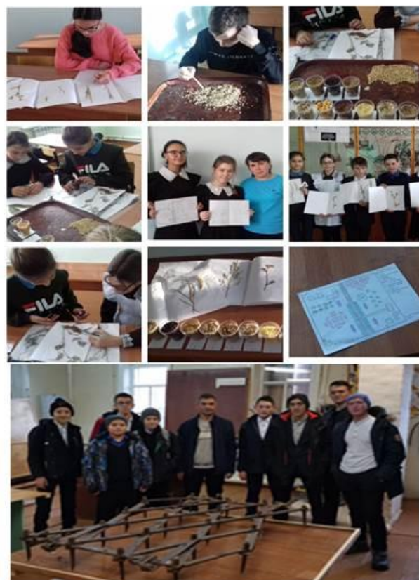
МБОУ «Салаусский многопрофильный лицей» направления:

направления: -Пчеловодство -Ландшафтный дизайн