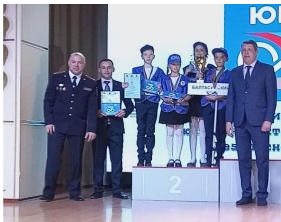
2 место в Республиканском конкурсе юных инспекторов движения «Безопасное колесо»