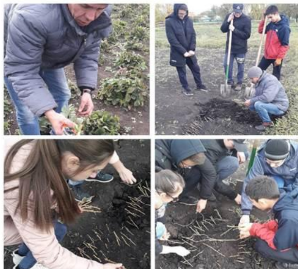
МБОУ «Карадуванская гимназия имени Баки Зиятдинова»

направление: -Ландшафтный дизайн и декоративное садоводство