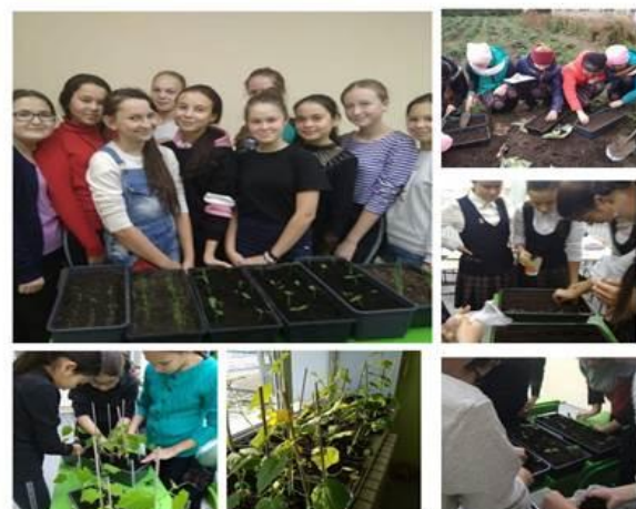
МБОУ «Нуринерская СОШ»