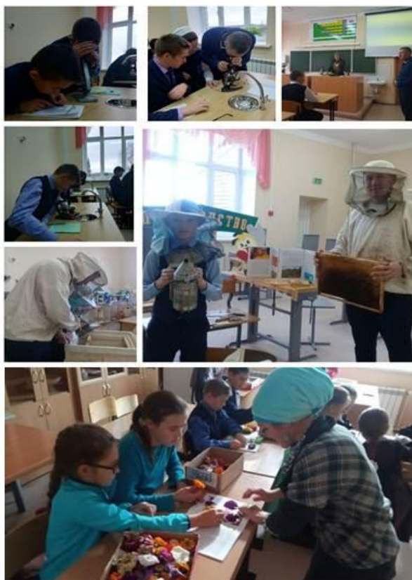
МБОУ «Бурбашская СОШ»

направления: -Пчеловодство -Ландшафтный дизайн