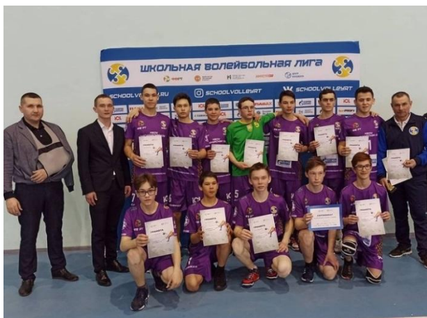
1 место на зональных соревнованиях по волейболу (ШВЛ), юноши