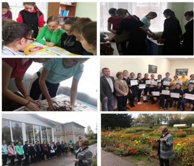
МБОУ «Пижмаринская ООШ»

-Обслуживание с/х машин -Электроника -Декоративное садоводство -и ландшафтный дизайн