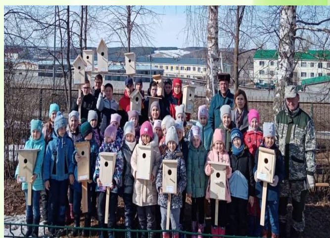
Участие ОУ и ДОУ в различных экологических акциях