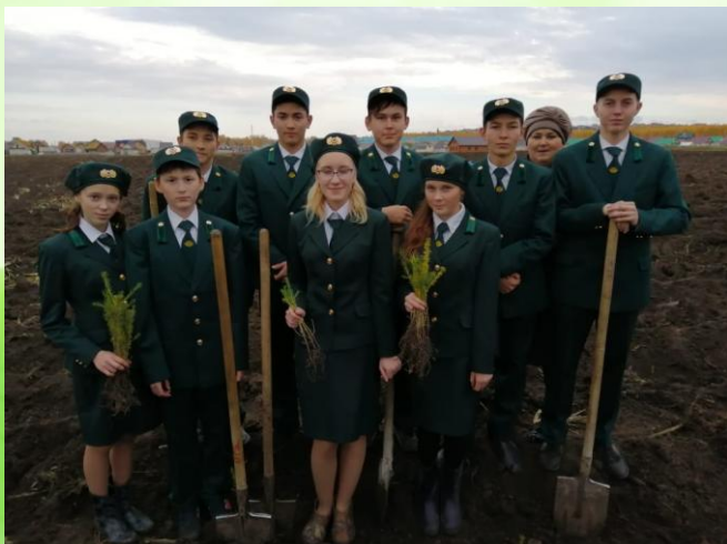
Природоохранная акция «Неделя леса – 2019»