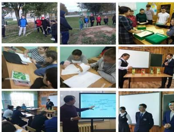
МБОУ «Нурминская СОШ»