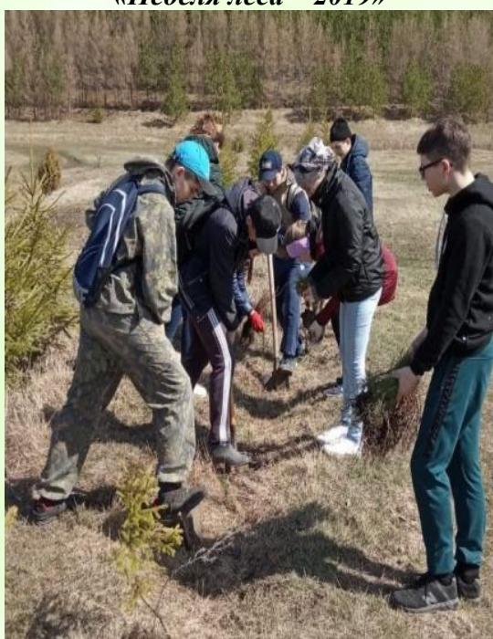
Ежегодная акция «Посади лес»