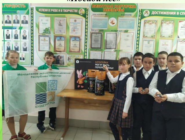
Природоохранная акция «Сдай батарейку- спаси планету»