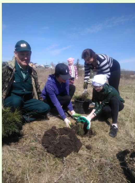
Акция «Лес Победы»