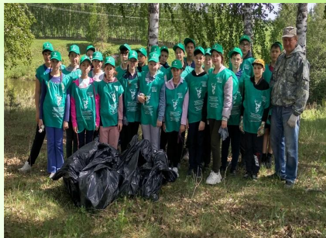
Субботники, акция «Чистый Татарстан»