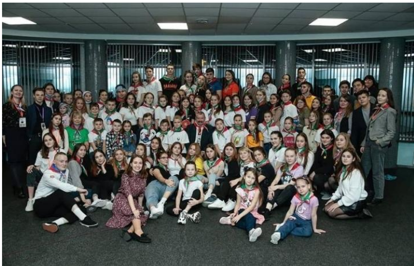
Участие в республиканской смене активистов «Галстучная страна»