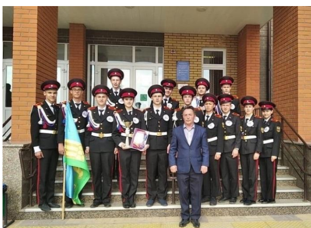
3 место на зональных соревнованиях военно-спортивной игры «Зарница»